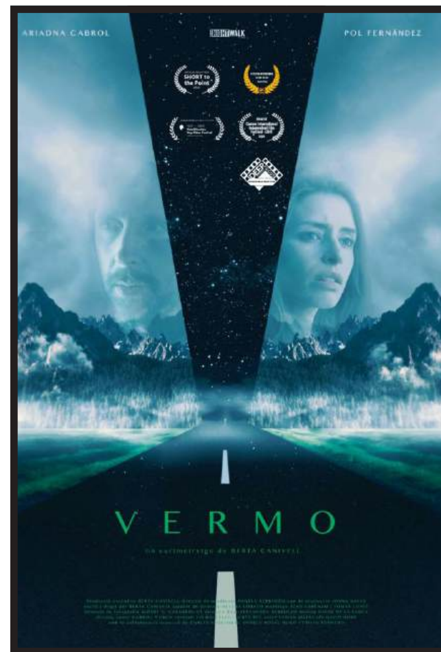
VERMO SHORTFILM PROD. CO.: NIGHTWALK FILMS DIR: BERTA CANIVELL D.O.P.: ALBERT G. CASADEMUNT LINK