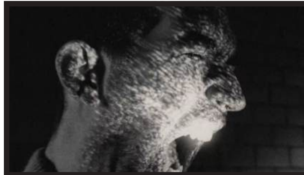
ALIMENT – COM ESPINES DIR: ALBERT SALA D.O.P.: JUANJO L SALAZAR LINK