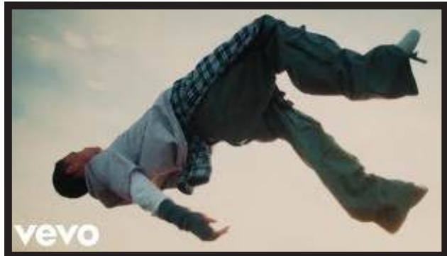
SEN SENRA – TE VA A SER MEJOR PROD. CO.: MAÑANA DIR: MARÍA SOSA D.O.P.: PEPE GAY LINK