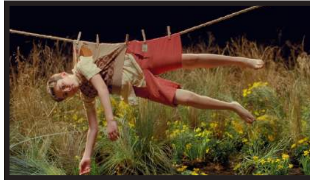
GUITARRICADELAFUENTE – DESDE LAS ALTURAS DIR: PEDRO ARTOLA D.O.P.: CARLES F. GALÍ LINK