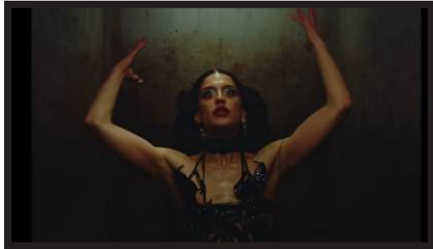
ARCA - RITUAL PROD. CO.: CAP STUDIO DIR: ALBERT MOYA D.O.P.: RYAN MARIE HELFANT LINK