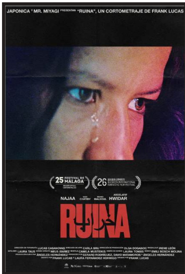
RUINA SHORTFILM PROD. CO.: JAPONICA FILMS DIR: FRANK LUCAS D.O.P.: LUCAS CASANOVAS LINK