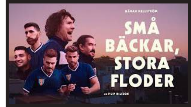
HÅKAN HELLSTRÖM – SMÅ BÄCKAR, STORA FLODER PROD. CO.: SMILE DIR: FILIP NILSSON D.O.P.: JALLO FABER, FSF, FNF LINK